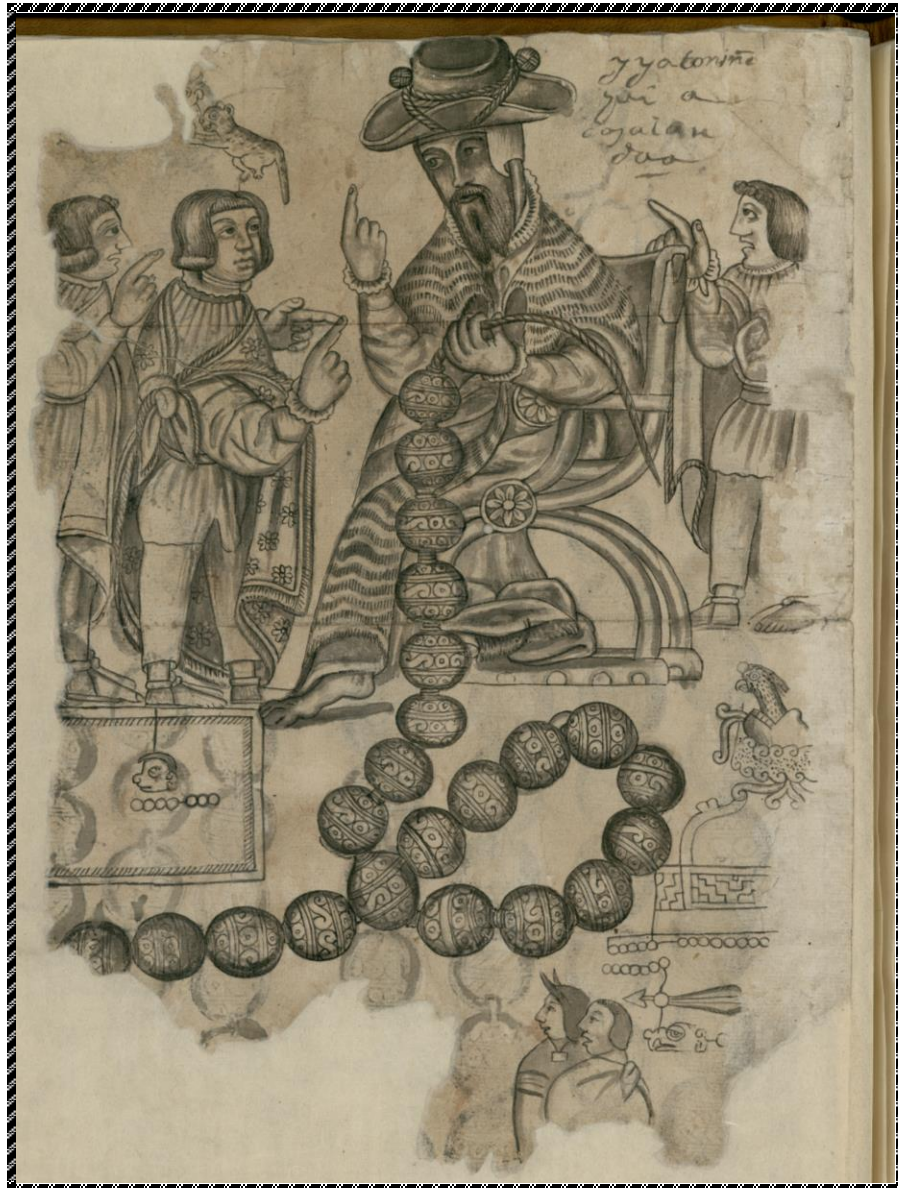
Fuente: Códice Yanhuitlán, lámina 13. Referencia: 86922-4 1010404. Biblioteca Histórica José María Lafragua, Benemérita Universidad Autónoma de Puebla, Puebla, México.

El Colegio de México, 20 y 21 de noviembre de 2019